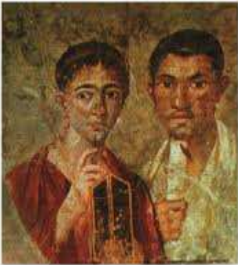
Portrait d'un boulanger et de son épouse à Pompéi