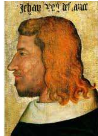
Portrait de Jean II Le Bon