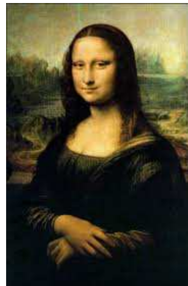
La Joconde Léonard de Vinci