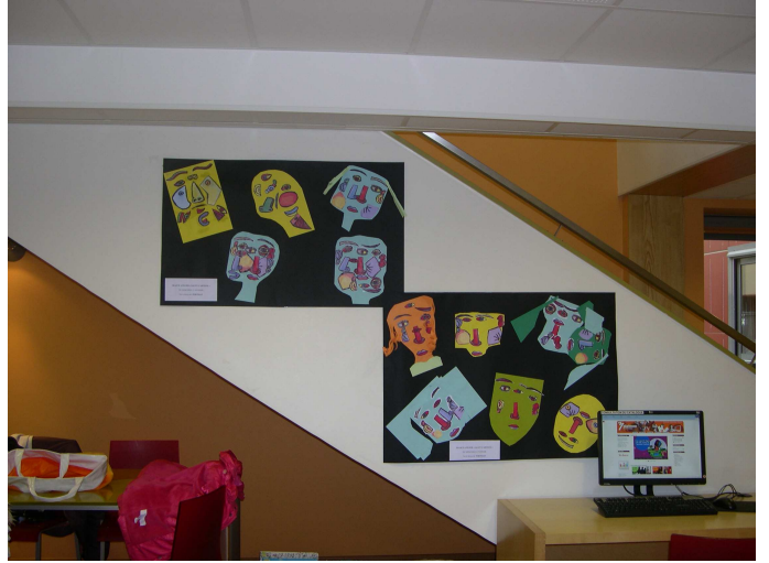
Résultat de l'atelier réalisé avec les enfants.