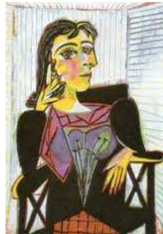
De face et de profil en même temps