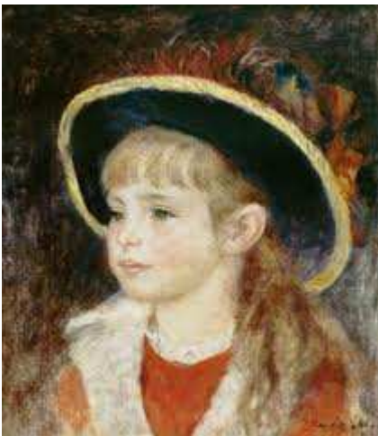
Fillette - Renoir