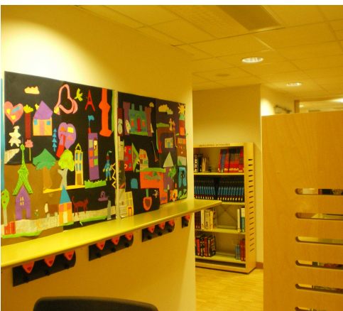
Exemple de fresque réalisée par les enfants.