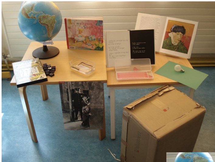
Objets seuls (↑)