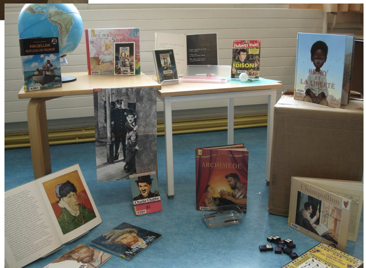
Avec tous les documents (→)